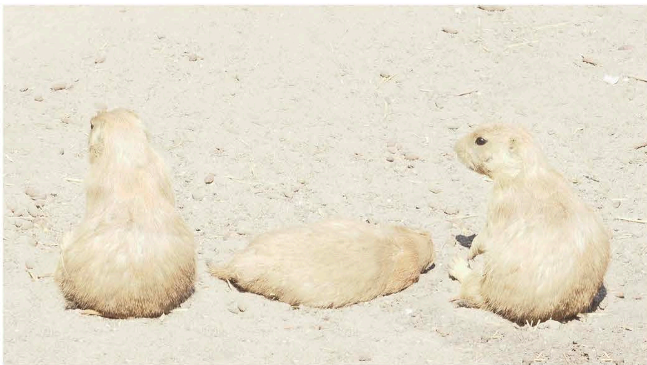
Marjan Laaper, The Gathering (Three Prairie Dogs), 2025, NL=US Art

In de praktijk van Laaper fungeert video als een sculpturaal medium. Een klassiek sculptuur heeft een fysieke positie in de ruimte en vraagt om een lichamelijke verhouding van de kijker. Laaper filmt vanuit één vast standpunt, dat van de toeschouwer, met minimale beweging, extreme vertraging en geen narratieve ontwikkelingen of perspectiefwisselingen. De kijker staat letterlijk tegenover het beeld. Om die reden functioneren haar videowerken niet als cinema of als filmische sequenties, maar als een object in de ruimte waar je je toe verhoudt. Een sculptuur verandert bovendien niet wezenlijk: je ervaart duur door je eigen aanwezigheid. Zo ervaar je ook het werk van Laaper. Haar werken worden monumentaal geprojecteerd, vaak groter dan levensgroot. Dat geeft de videowerken een fysieke schaal. Het werk wordt onderdeel van de ruimte, zoals een sculptuur dat zou zijn. Als kijker word je uitgenodigd om beter te kijken, om kleine verschuivingen waar te nemen en om je bewust te worden van je eigen waarneming.